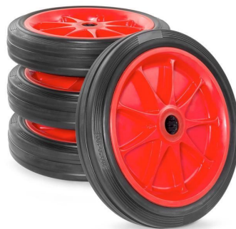
Vollgummirad 260 mm Ø x 56 mm