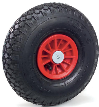
Luftrad 260 mm Ø x 85 mm mit Ventil