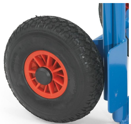
pannensicheres PU-Rad 260 mm Ø x 85 mm