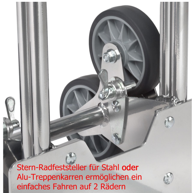
Stern-Radfeststeller für Stahl oder Alu-Treppenkarren ermöglichen ein einfaches Fahren auf 2 Rädern