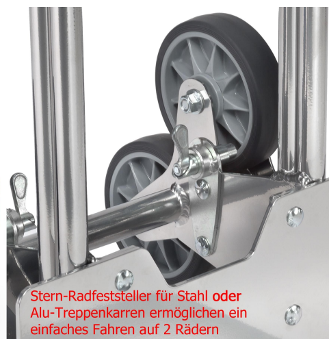
Stern-Radfeststeller für Stahl oder Alu-Treppenkarren ermöglichen ein einfaches Fahren auf 2 Rädern