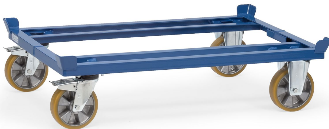
4 Lenkräder, 2 x mit Feststeller