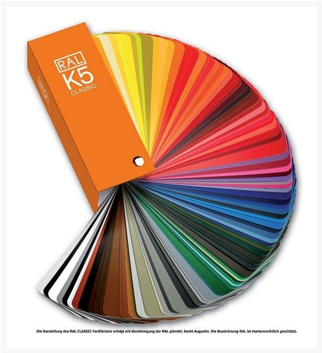
Die Darstellung des RAL CLASSIC Farbfächers erfolgt mit Genehmigung der RAL gGmbH, Sankt Augustin. Die Bezeichnung RAL ist markenrechtlich geschützt.