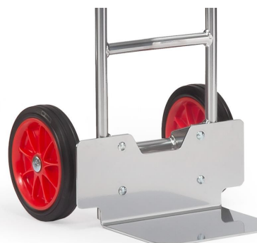
Vollgummiräder 260 mm Ø x 56 mm