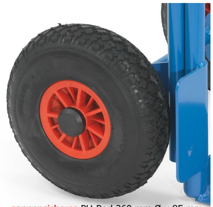
pannensicheres PU-Rad 260 mm Ø x 85 mm