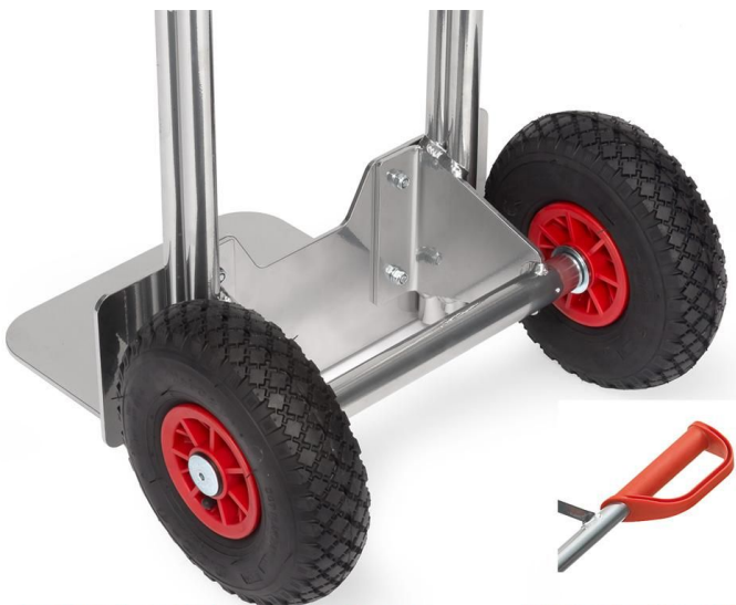
Lufträder 260 mm Ø 85 mm