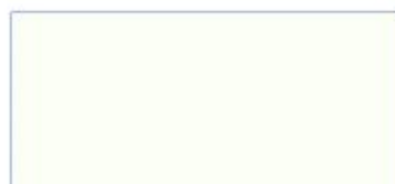
RAL 9010 reinweiß