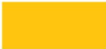
RAL 1023 verkehrsgelb