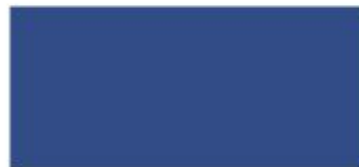
RAL 5002 ultramarinblau