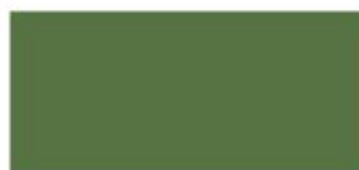
RAL 6010 grasgrün