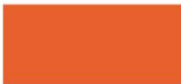
RAL 2004 reinorange