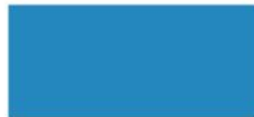
RAL 5015 himmelblau