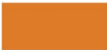
RAL 2000 gelborange