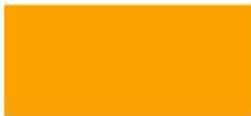
RAL 1028 melonengelb