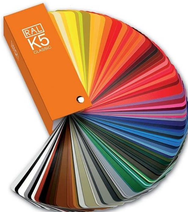
Die Darstellung des RAL CLASSIC Farbfächers erfolgt mit Genehmigung der RAL gGmbH, Sankt Augustin. Die Bezeichnung RAL ist markenrechtlich geschützt.