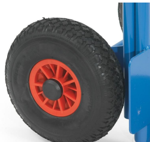
pannensicheres PU-Rad 260 mm Ø x 85 mm