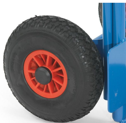
pannensicheres PU-Rad 260 mm Ø x 85 mm