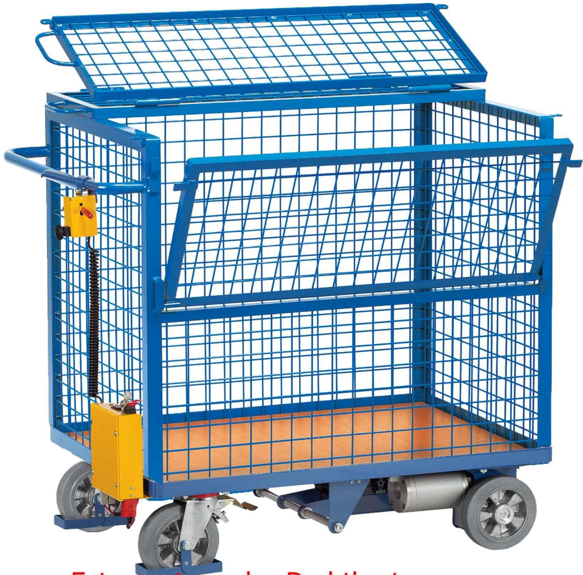
Fotomontage des Drahtkastenwagens mit Klappdeckel - incl. Elektroantrieb